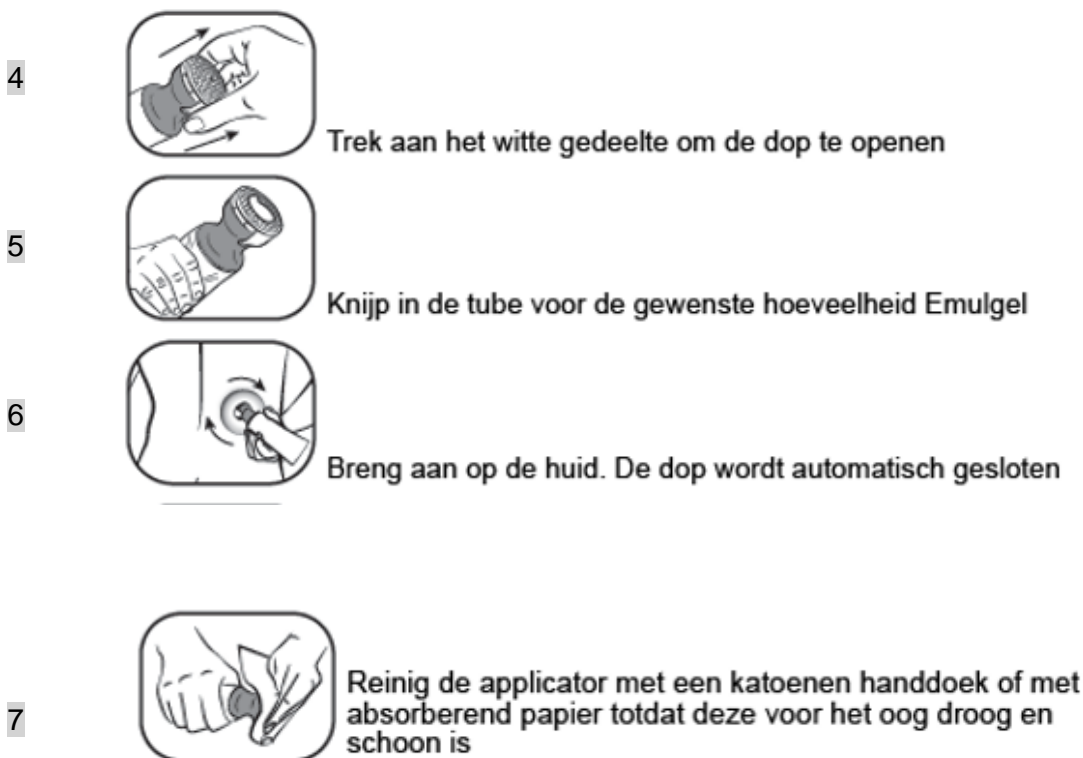
Figuur 2: Doseer- en smeerdop instructie stap 4 t/m 7

Gebruik de applicator niet opnieuw voor een andere tube. Volg bij het weggooien van de tube de in uw land geldende regels voor het weggooien van medicijnen.